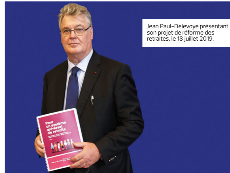
Jean Paul-Delevoye présentant son projet de réforme des retraites, le 18 juillet 2019.

des régimes sur la base des données réelles, conteste l'idée qu'une longue carrière signifie pauvreté de la pension. Il pointe toutefois la double question de la situation de l'âge d'annulation de la décote pour les femmes (67 ans) et le droit au départ avant le nouvel âge légal, donc progressivement décalé, avec la prise en compte des trimestres gratuits permis par la naissance et l'éducation d'enfants.