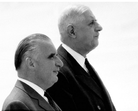
1967, Georges Pompidou, Premier ministre, publie les ordonnances instaurant le strict paritarisme de représentation dans les conseils des caisses de Sécurité sociale et confirme la séparation des risques entre quatre branches pour le régime général. (Cnamts, Cnaf, Cnav et Accoss).

de sens sur une des ambitions premières de l'institution que doit être sa capacité à prévenir et anticiper les risques sociaux, professionnels et de la vie.