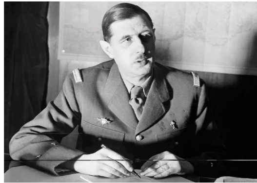
Octobre 1945, le général de Gaulle, président du gouvernement provisoire, signe les ordonnances créatrices de la Sécurité sociale.

Perçue dès l'origine comme une sorte de contrat républicain, profondément solidaire par nature, la Sécurité sociale demeure évidemment la conquête la plus essentielle de l'après-guerre, et bien au-delà. Elle imprègne tellement la vie quotidienne du pays que ses réalités s'amalgament avec celle d'un guichet public ouvert en permanence et sans limite. Les péripéties des LFSS illustrent cette mutation. La lecture, rebutante toutefois, des projets de loi organique de financement est un stigmate de nos excès parmi bien d'autres. Tout cela au risque d'ailleurs d'une double perte