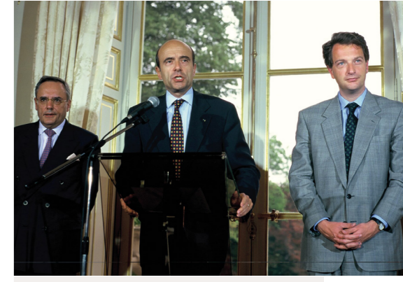
1996, les ordonnances Juppé, Barrot et Gayraud instaurent la loi organique de financement (LFSS) et confirment la « prise en main » de l'État.

Prochain épisode : Sécu, des faux-semblants et des questions.