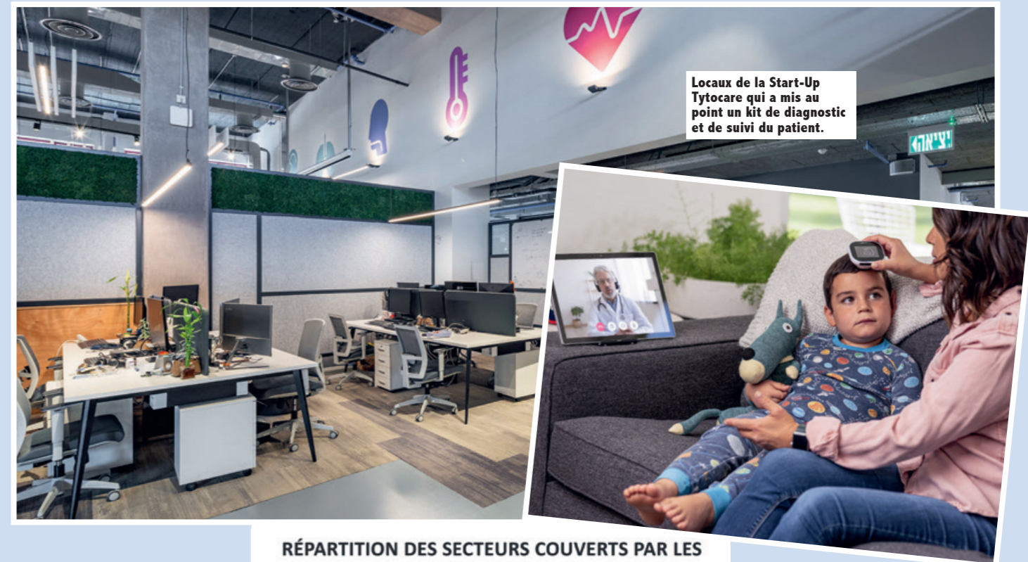
Locaux de la Start-Up Tytocare qui a mis au point un kit de diagnostic et de suivi du patient.