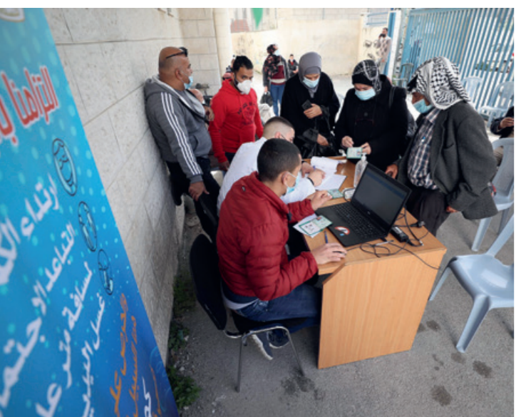
Employés de l'Autorité Palestinienne inscrivant des palestiniens sur une liste d'attente de vaccination.