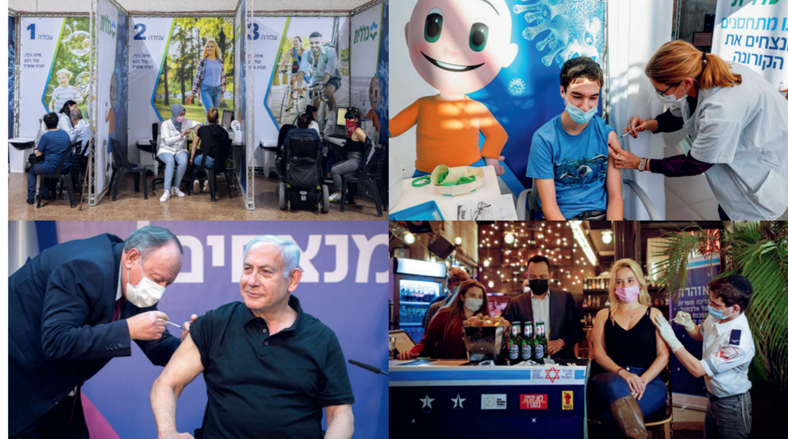
ISRAËL DEMEURE LA SEULE NATION OÙ, EN CAS DE CRISE MAJEURE, LA CLASSE POLITIQUE ET LES ACTEURS LOCAUX DÉPASSENT LEURS ANTAGONISMES POUR AGIR EFFICACEMENT ET SURMONTER LES DÉFIS.

Un effort spécifique a-t-il été fait en termes de communication ?