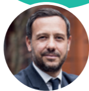
Adrien Taquet, secrétaire d'État à l'Enfance.

“ La Mutualité Française a tôt su initier le développement d'offres locales imaginatives et innovantes de solutions d'accueil du jeune enfant en horaires étendus ou atypiques. ”