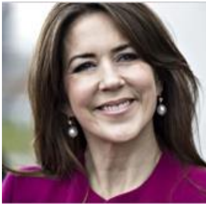
Son Altesse Royale la Princesse Mary