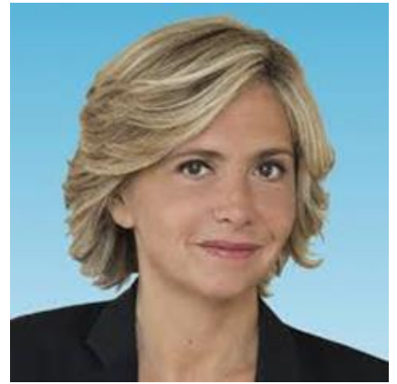
Valérie Pécresse, Présidente du Conseil Régional d'Ile-de-France